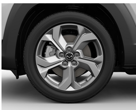
18-ZOLL-LEICHTMETALLFELGEN IN SILBER MIT 215/55 R18 BEREIFUNG